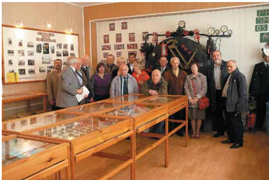
Członkowie Klubu w Sali Tradycji PKP CARGO w Szczecinie

Opracowanie: Anna Bryksy – Sekretarz KKMHiZT