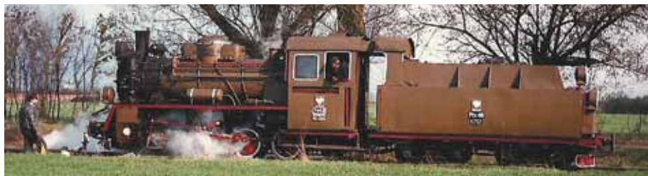
Fotografia zabytkowej lokomotywy