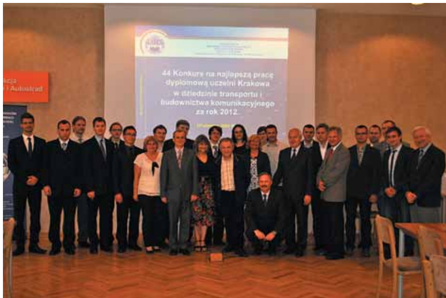
Wspólne pamiątkowe zdjęcie