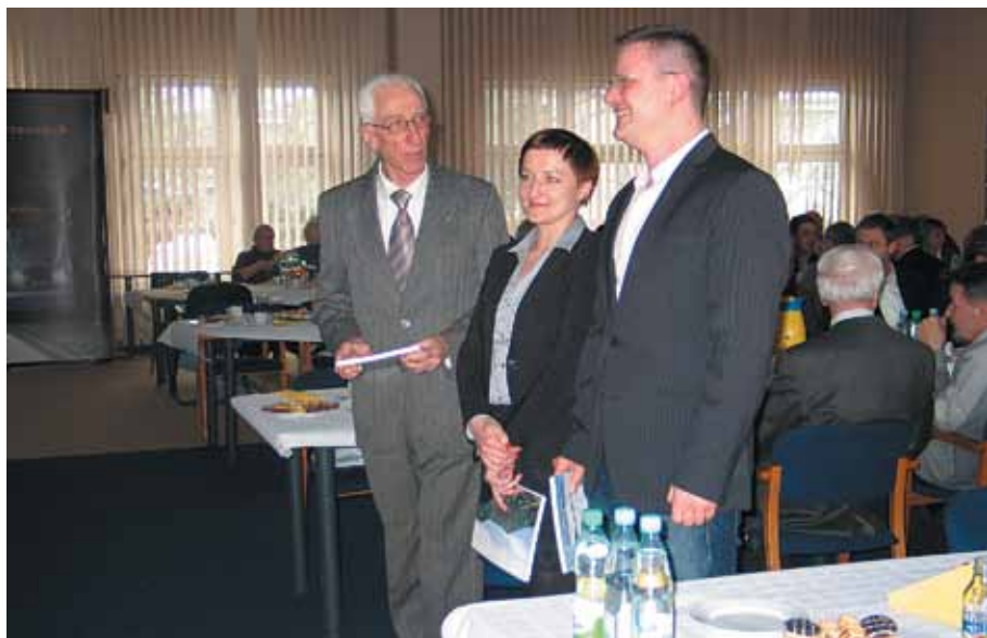
Nowi członkowie przyjęci do Oddziału