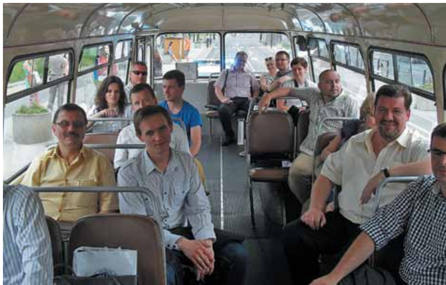
Uczestnicy konferencji w czasie przejazdu „Ogórkiem”