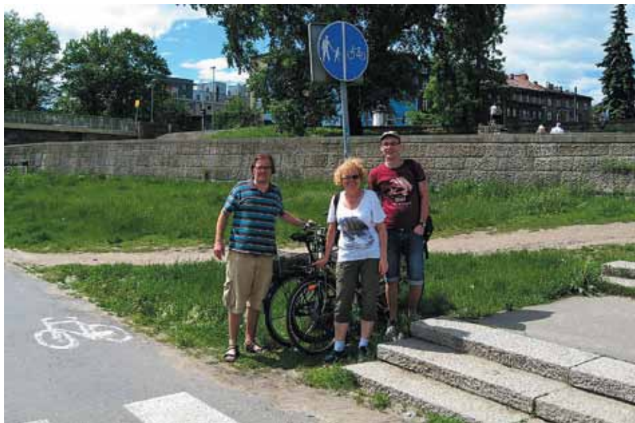
Uczestnicy wycieczki rowerowej

Czterogodzinna wycieczka zakończona została nad Wisłą w pobliżu Wawelu. W miłej atmosferze, przy wspólnym posiłku uczestnicy przedyskutowali wszystkie rozwiązania, z którymi zapoznali się w trakcie wspólnego przejazdu przez miasto. Poruszanie się rowerem dało szansę na zwiedzenie Krakowa znacznie szybciej i swobodniej niż samochodem.