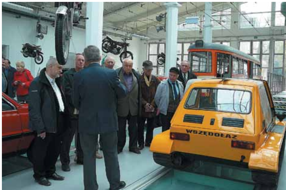
W Muzeum Techniki i Komunikacji Zajezdnia Sztuki w Szczecinie