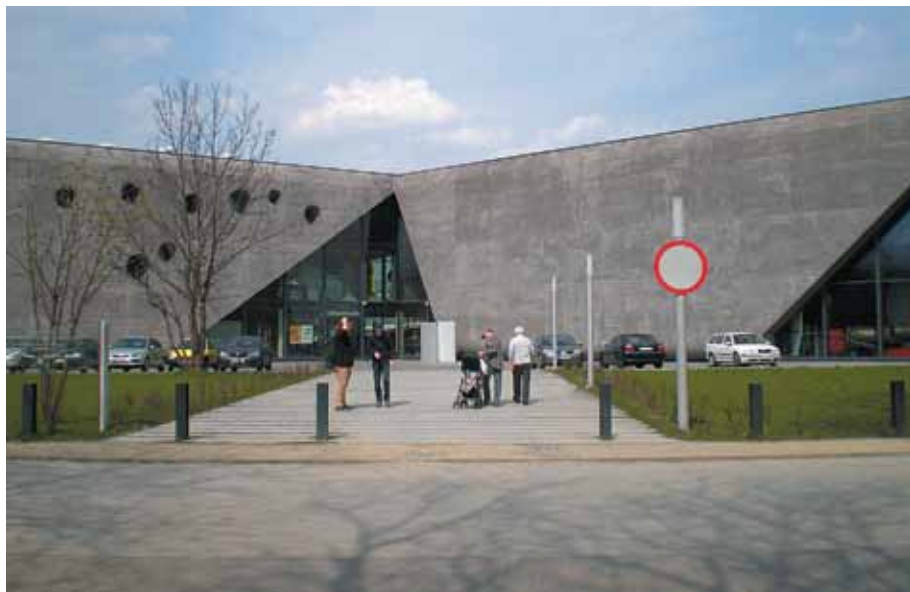
Członkowie Klubu Seniora tuż przed wejściem do Muzeum