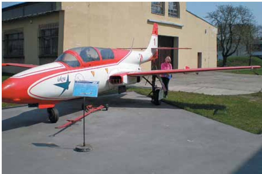
Kol. I.Tyska obok eksponatu samolotu Iskra na dziedzińcu Muzeum

Klub Seniora, Oddział SITK RP w Krakowie