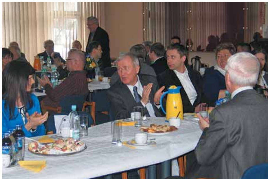
Na sali obrad