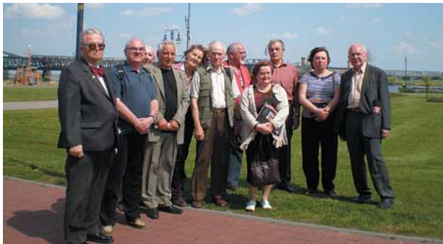
Uczestnicy wyjazdu na tle mostu w Tczewie