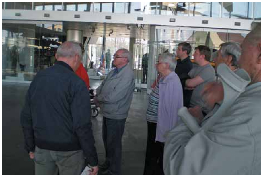
Seniorzy w pierwszej hali wystawowej Muzeum