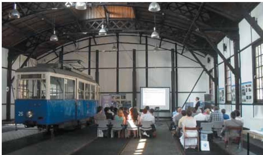
Obrazy konferencji w jednej z hal Muzeum Inżynierii Miejskiej

W dniu 21 czerwca br. w Muzeum Inżynierii Miejskiej w Krakowie odbyła się konferencja poświęcona tej tematyce zorganizowana przez SITK RP Oddział w Krakowie wraz z Zarządem Infrastruktury Komunalnej i Transportu. Konferencja zgromadziła przedstawicieli m.in. zarządców dróg z kilku miast Polski, którzy mieli okazję zapoznać się z wdrażanymi w Krakowie przedsięwzięciami zrealizowanymi przez ZIKiT w ramach projektu „Rozwój Systemu Zarządzania Transportem Zbiorowym w Krakowie” (łącznie w konferencji uczestniczyło 47 osób).