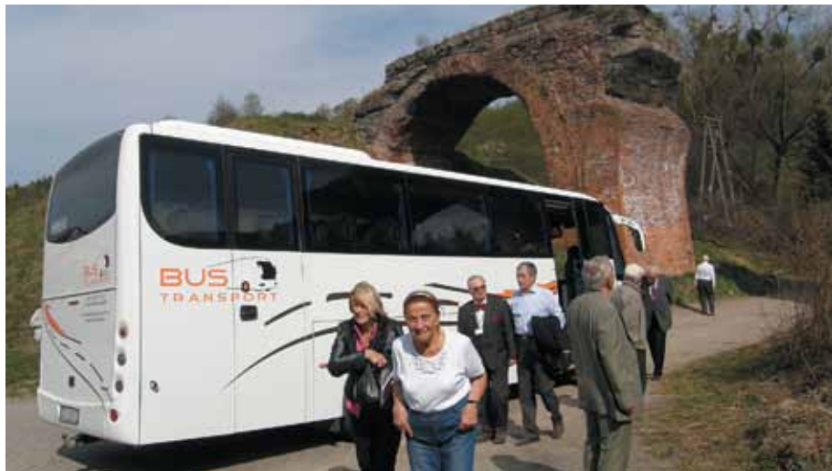
Zwiedzanie trasy budowanej Pomorskiej Kolei Metropolitalnej

Klub Seniora, Oddział SITK RP w Krakowie