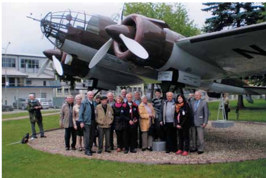
Seniorzy przed samolotem Łoś

Nazwa Zakładów może być trochę myląca, gdyż obecnie jest to firma amerykańska - koncern Sikorsky, utworzona z dawnej fabryki samolotów. W czasach PRL fabryka zatrudniała aż 25 tys. pracowników, obecnie załoga liczy ok. 1000 osób. Produkuje się tu głównie helikoptery wojskowe "Black Hawk", a także samoloty transportowe dwusilnikowe M-28 B/PT/GC zwane „Glass Cocpit”. Uczestnicy zapoznali się z procesem produkcji części do samolotów oraz montażem płatowców. PZL to zakład nowoczesny, dysponujący najnowszymi światowymi technologiami produkcyjnymi. Na terenie zakładu panują sterylne warunki, a proces produkcyjny jest realizowany z wielką precyzją.