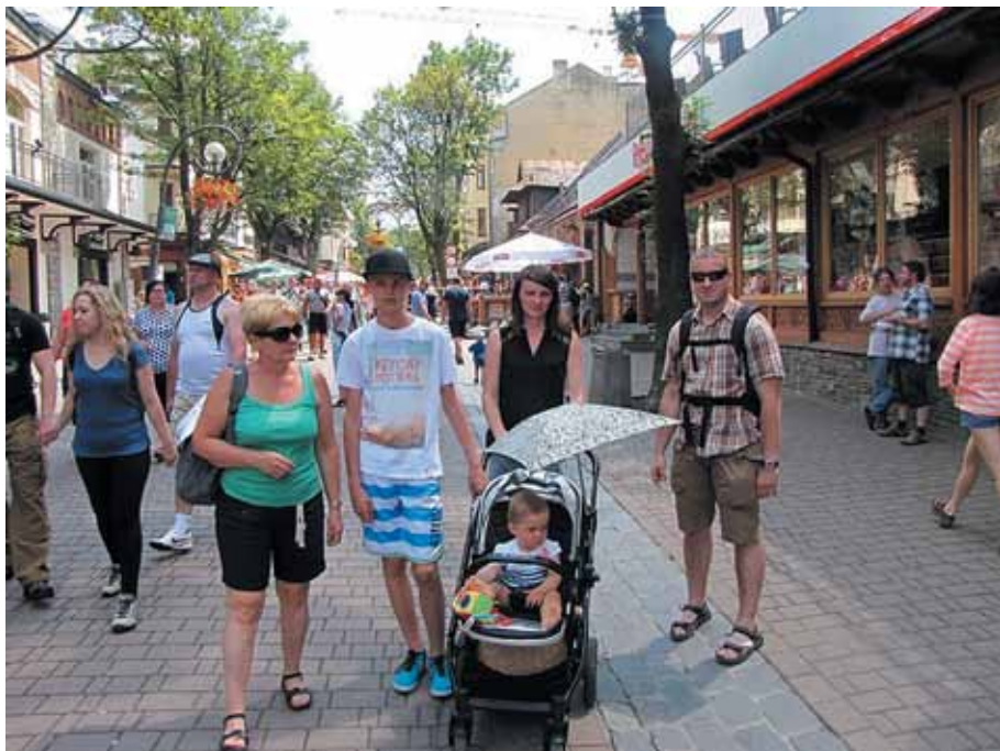
W Zakopanem na Krupówkach

Jak co roku, członkowie Koła w Mota-Engil Central Europe S.A., mieli okazję spędzić lipcowy weekend 17 – 19 lipca br. w Tatrach. Tegoroczna wyprawa to już ósma z kolei wycieczka w celu zdobycia kolejnych szczytów naszych polskich gór.