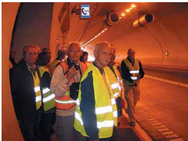
Efekt końcowy inwestycji

Uczestnicy wycieczki po wysłuchaniu historii budowy tunelu „Emilia” udali się do Koniakowa i tam w przydrożnej karczynie „Ochodzita” zjedli obiad. Następnie wyruszyli w dalszą drogę jadąc drogą S 69. Uczestnicy mogli zapoznać się z danymi technicznymi dotyczącymi tej drogi, podziwiali też malownicze krajobrazy trasy. Duże wrażenie robi odcinek w bardzo głębokim przekopie na terenie nieczynnego kamieniołomu; przed osuwającymi się skałami ochrania go prawie pionowa ściana oporowa.