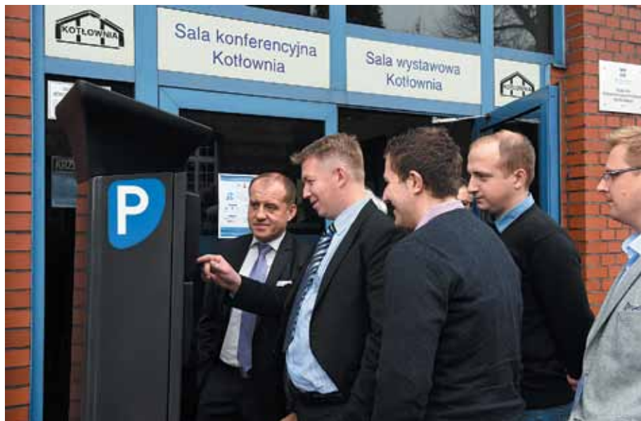
Uczestnicy konferencji przy parkomacie

osoba wygrała bilet wstępu na zwiedzanie stadionu Wisły. Nagrodą główną była piłka z podpisami piłkarzy Wisły.