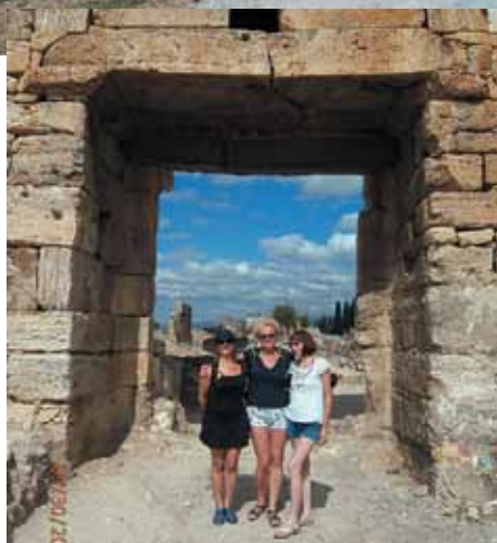
Zwiedzanie ruin starożytnego miasta Hierapolis