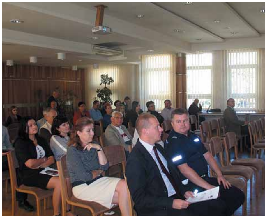
Na sali obrad