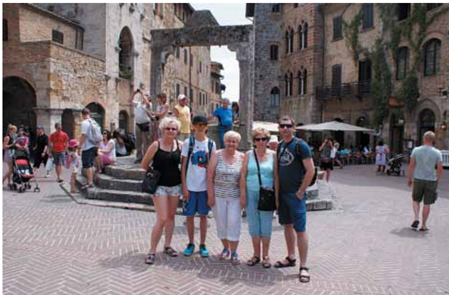
Uczestnicy wyjazdu w miasteczku San Gimignano

Trzeci dzień wyprawy rozpoczęto od zwiedzania urokliwego miasta San Gimignano, zwanego również miastem wież, a następnie średniowiecznego miasteczka Monteriggioni otoczonego murem obronnym oraz regionu Chianti, słynącego we Włoszech z doskonałych win. W kolejnym dniu zwiedzono Lukkę – miasto słynące ze swoich murów, kościołów i wież. Następnie uczestnicy udali się do Pizy - miasta znanego wszystkim z krzywej wieży.