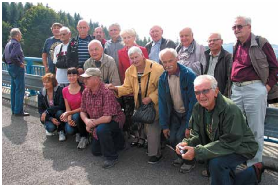
Uczestnicy wyjazdu technicznego zorganizowanego przez Klub Seniora

no drugi tunel ewakuacyjny, pomiędzy tunelami znajdują się cztery przejścia wyposażone w ognioodporne drzwi.