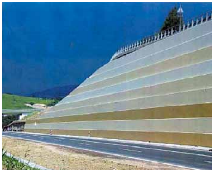
Ściana oporowa wykonana z żelbetowych paneli, tworzących mur o powierzchni blisko 4,5 tys m 2