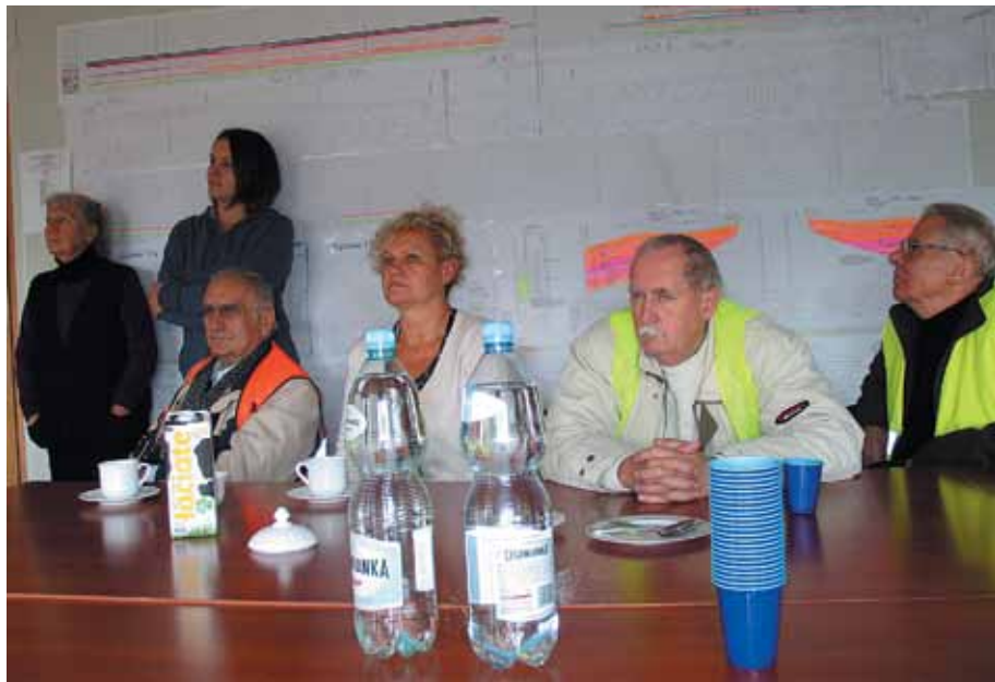
W biurze budowy łącznika autostradowego w Brzesku