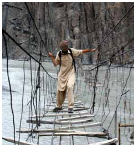
Jeden ze strasznych mostów, który służy również dzieciom idącym do szkoły

W czasie pierwszej prelekcji, która odbyła się w dniu 29 czerwca br. uczestnicy spotkania zapoznali się z mostami pięknymi, strasznymi i wyjątkowymi. W prelekcji uczestniczyło 11 osób.