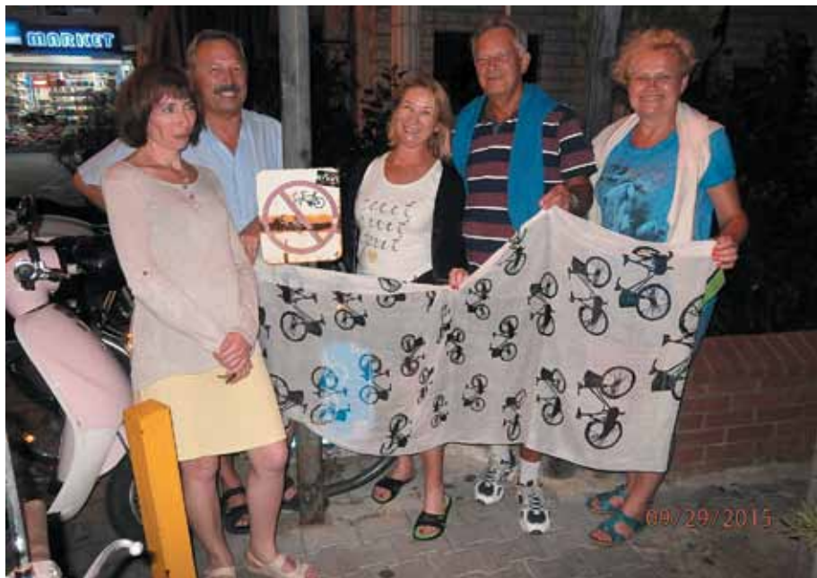
Wspólne zdjęcie przy ścieżce rowerowej