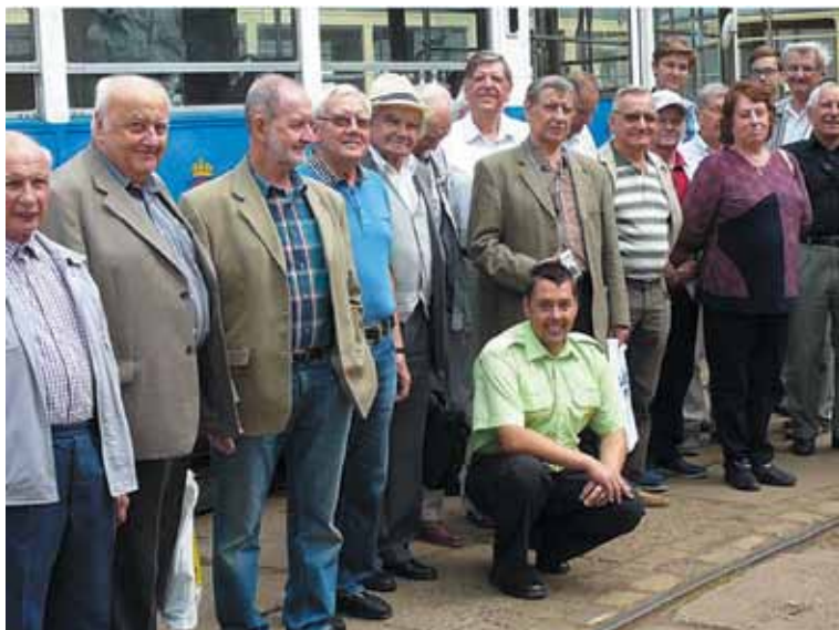
Uczestnicy spotkania w zajezdni przy ul. Madalińskiego