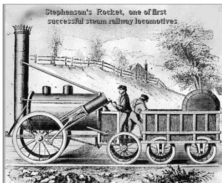
Lokomotywa Stephen's Rocket

W czasie kolejnej prelekcji, w dniu 5 października br., prelegent zapoznał uczestników z drugim podstawowym elementem kolei – trakcją. Poznano historię maszyny parowej, która została wykorzystana do obsługi masowego transportu. Przy okazji uczestnicy mogli dowiedzieć się, dlaczego Stephenson niesłusznie uważany jest za pierwszego konstruktora lokomotyw. W prelekcji uczestniczyło 12 osób.