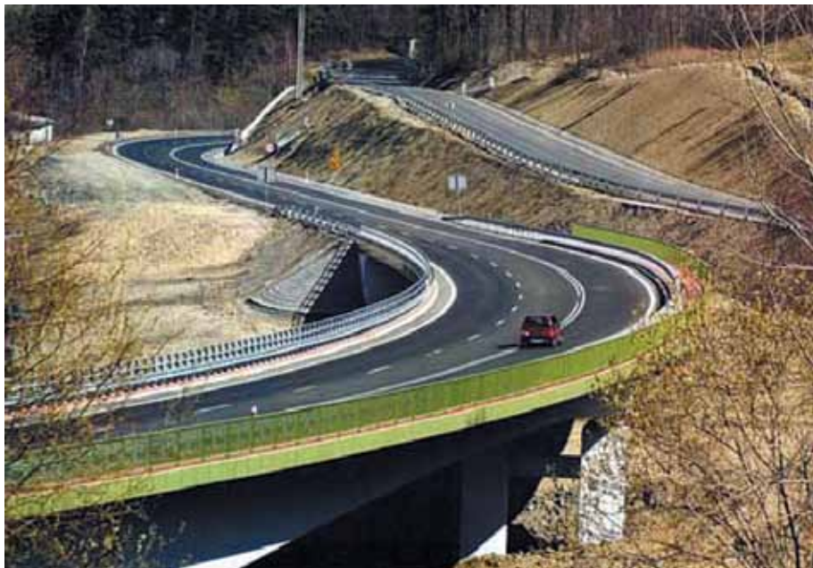
Estakada nad czynnym osuwiskiem koło Szarego. Powyżej widoczna droga krajowa nr 69 (widok w kierunku Milówki)