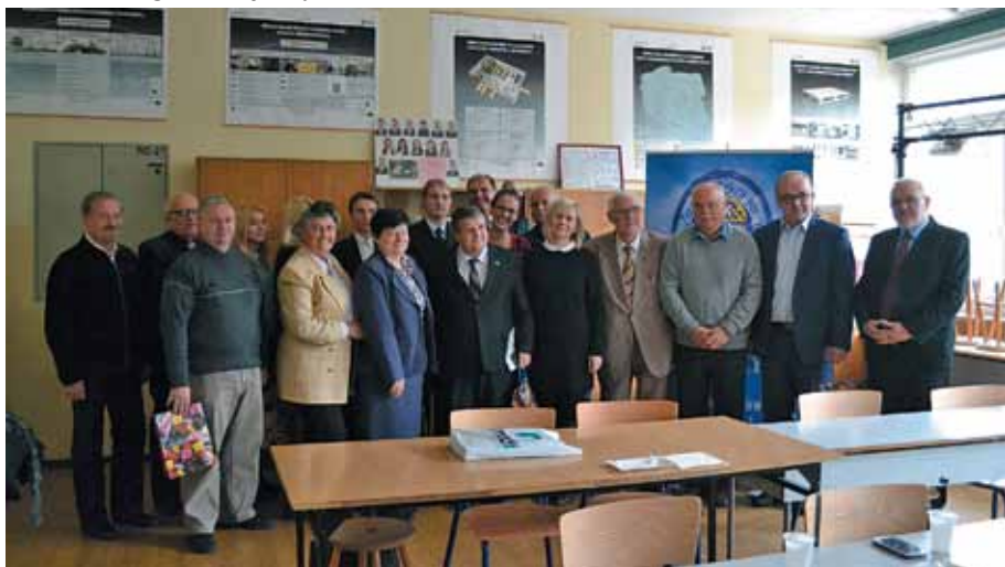
Uczestnicy konferencji w Zespole Szkół nr 1 w Krakowie