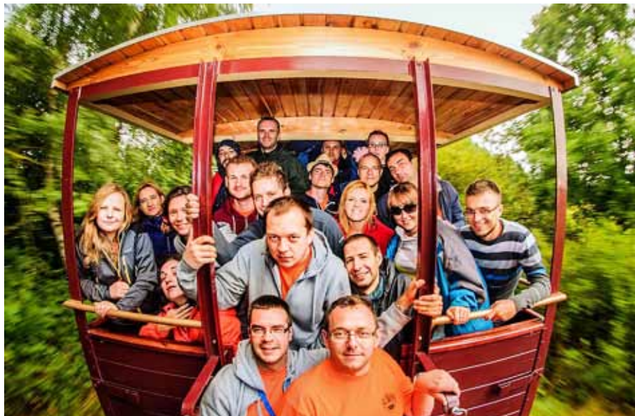
Podróż kolejką wąskotorową