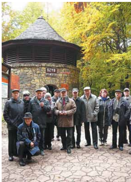
Uczestnicy spotkania przed wejściem do szybu Sylwester

W dalszej części dnia uczestnicy udali się autokarem do Parku Reptowskiego, gdzie znajduje się szyb Sylwester, będący wejściem do słynnej Sztolni Czarnego Pstrąga. Uczestnicy, pod opieką przewodnika, zeszli krętymi metalowymi schodami na głębokość prawie 40 m pod ziemię. W latach 1547 - 1834 pod terenami obecnego miasta Tarnowskie Góry wydrążono kilka sztolni, którymi odprowadzano wodę z podziemnych wyrobisk kopalni srebra, do rzek Dramy i Stoły. W 1957 roku udostępniono dla ruchu turystycznego niewielki fragment podziemi pod nazwą Sztolnia Czarnego Pstrąga. Do jej wnętrza prowadzą dwa szyby: Ewa i Sylwester - pod ziemią łączy je 600 metrowy chodnik wodny. Podziemny rejs łodziami kopalnianą sztolnią wodną pozostawia niezapomniane wrażenia.