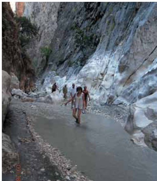
Trudna trasa w wąwozie Pamukkale