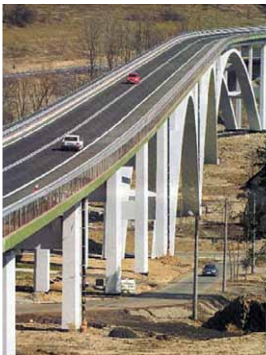
Nowy żelbetowy wiadukt