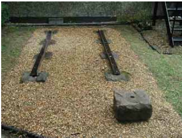
Prymitywne jeszcze szyny przy budowie toru kolejowego

W dniu 27 lipca br. rozpoczął się nowy cykl spotkań, tym razem poświęcony lokomotywowi. Uczestnicy spotkania (11 osób) mogli poznać historię powstania jednego z podstawowych elementów kolei – toru złożonego z dwóch równoległe biegnących szyn.