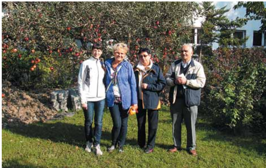
W ogrodzie przy Muzeum Motyli w Bochni