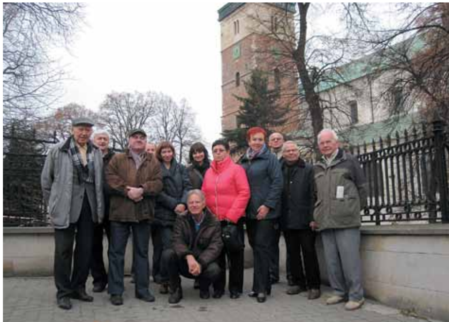
Bazylika Grobu Bożego w Miechowie

Na koniec grupa udała się do restauracji Zameczek, gdzie przy ciepłym posiłku dzielono się wrażeniami z wyprawy i snuto plany na kolejną.