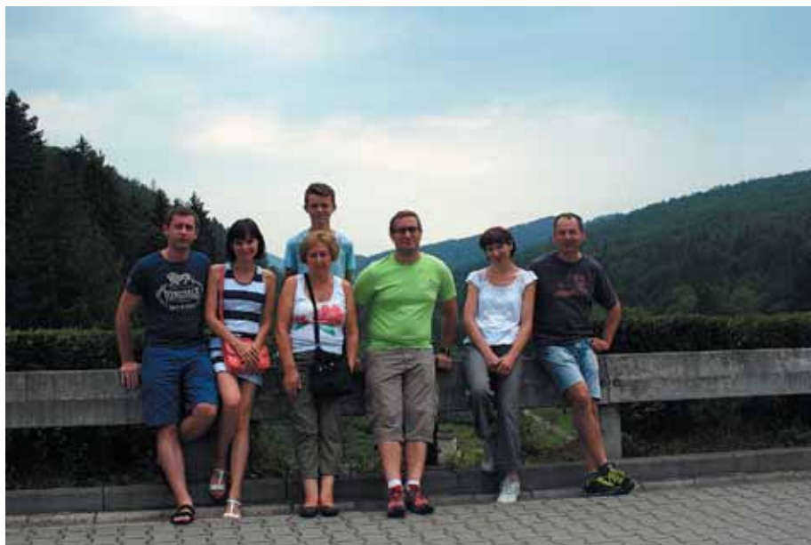
Uczestnicy wycieczki w Wiśle