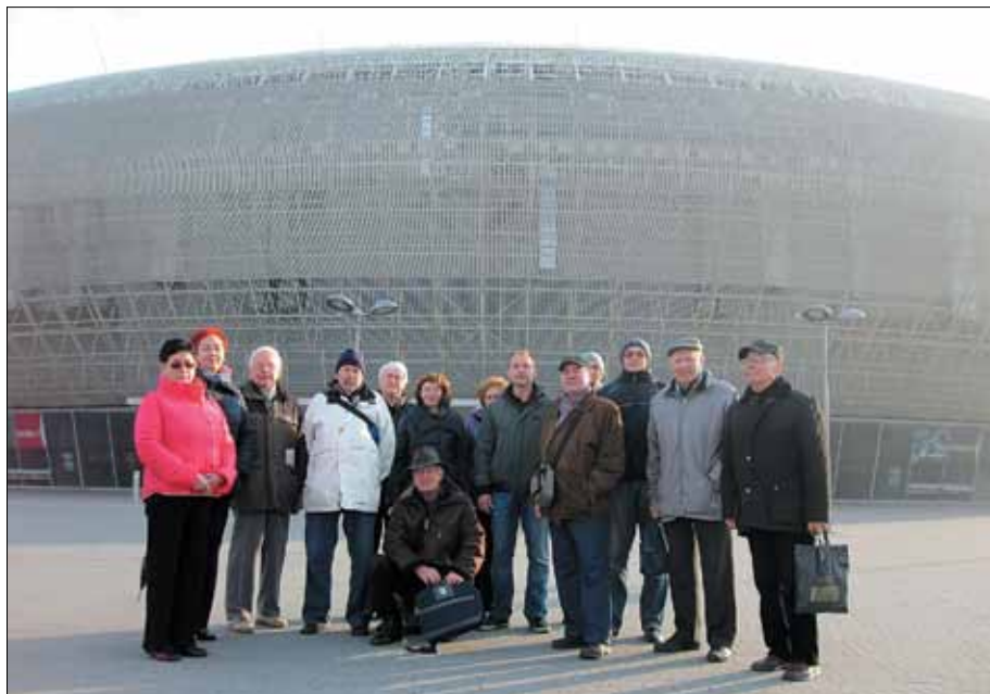
TAURON Arena Kraków

przywiezionej do Miechowa przez pobożnego Jaksę w roku 1163. Na uwagę zasługuje również główny ołtarz przedstawiający scenę Zmartwychwstania.