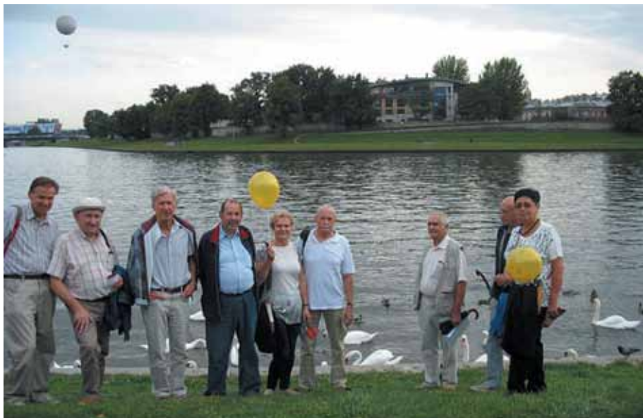
Na Bulwarach Wiślanych

uczestniczyli również sympatycy naszego Stowarzyszenia, w tym dwóch kolegów z Kanady.