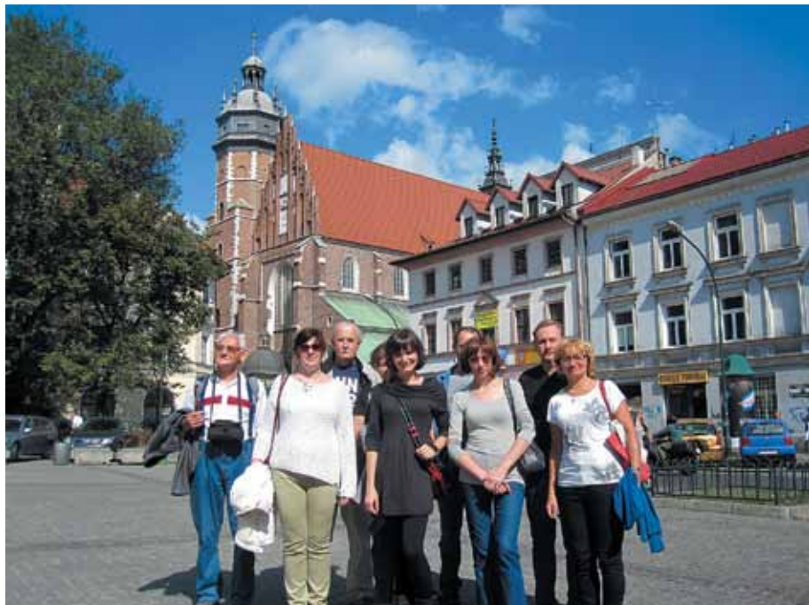
Plac Wolnica na krakowskim Kazimierzu

Ostatnim punktem wycieczki było przejście ulicami Podgórze Szlakiem Pamięci, rozpoczynającym się od fragmentów murów getta żydowskiego, a kończącym na Placu Wolnica na krakowskim Kazimierzu.