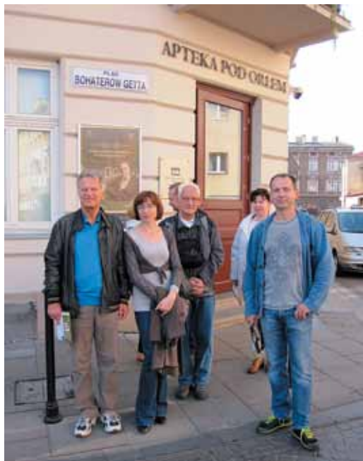
Uczestnicy wycieczki przed Apteką Pod Orłem

się tutaj 6 września 1939 roku i brutalnie przerwali wielowiekową historię polsko-żydowskiego Krakowa. Wydarzenia II wojny światowej krzyżują się tutaj z codziennym życiem, życie prywatne – z tragedią, która dotknęła cały świat.