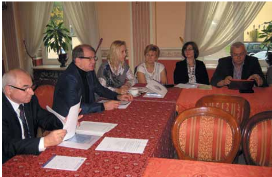
Obrady seminarium sekretarzy i księgowych