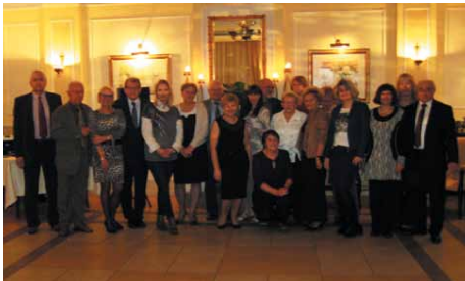
Pamiątkowe wspólne zdjęcie uczestników spotkania