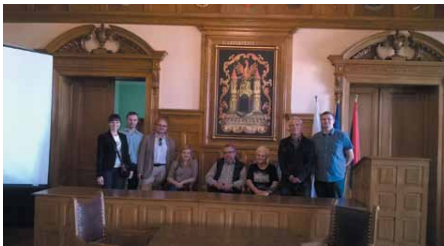
Urząd Miasta – Sala Sesyjna