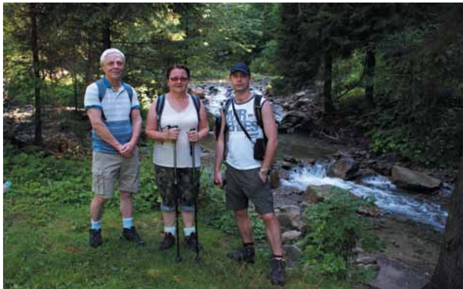
W drodze na Przehybę