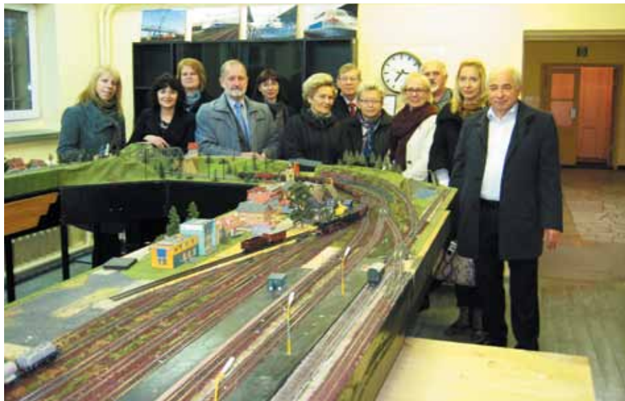
Wspólne zdjęcie przy makiecie kolejki w siedzibie Oddziału w Ostrowie Wielkopolskim.