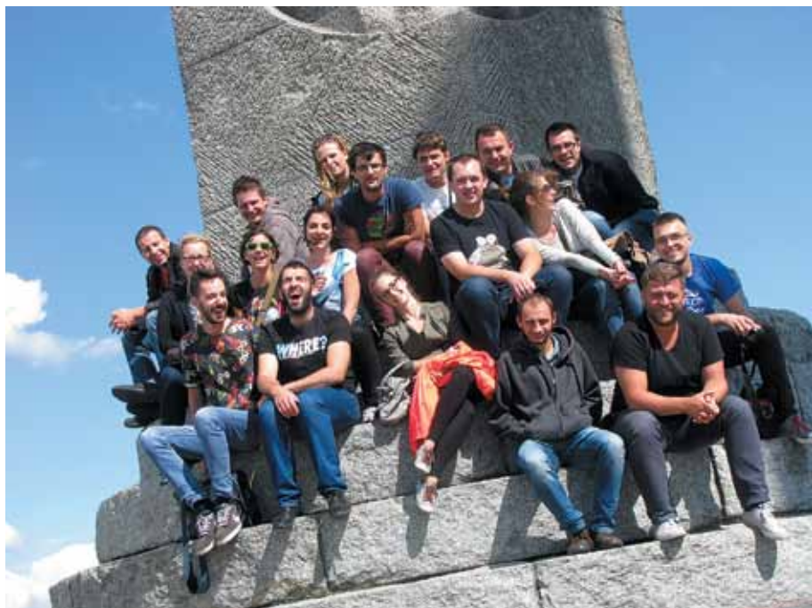
Na polach Grunwaldu

Opracowanie: Emil Markowiak Koło SITK RP w Politechnice Krakowskiej