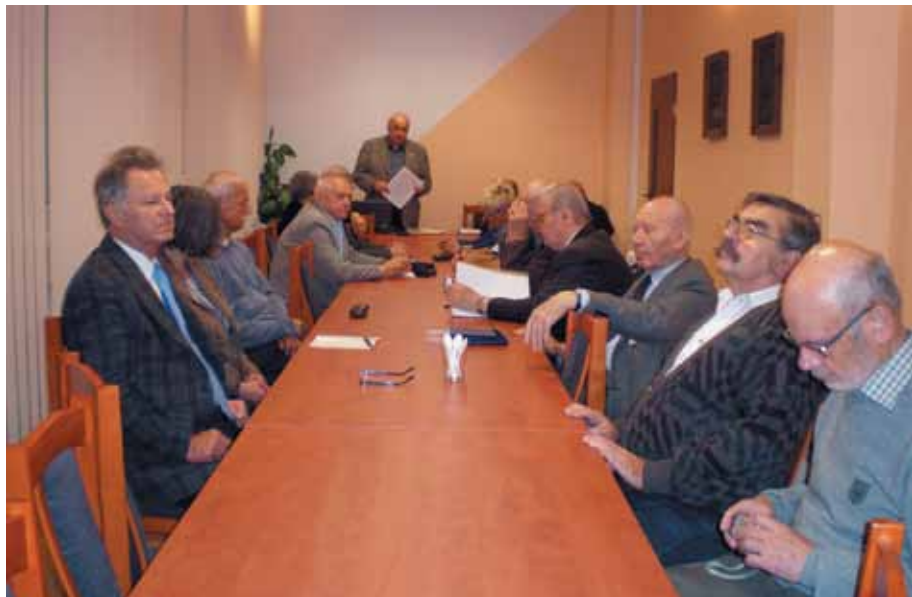
Zebranie plenarne Klubu