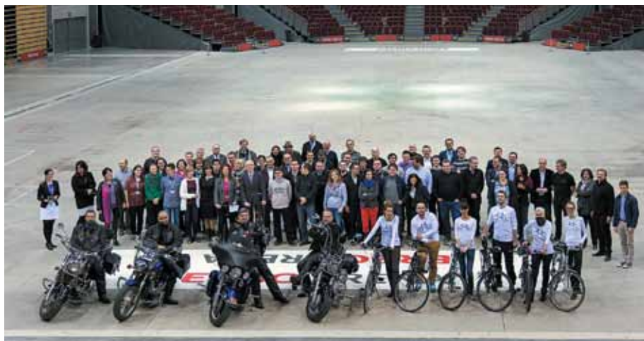
Uczestnicy konferencji podczas wycieczki w Ergo-arenie

Opracowanie: Agnieszka Domieniecka