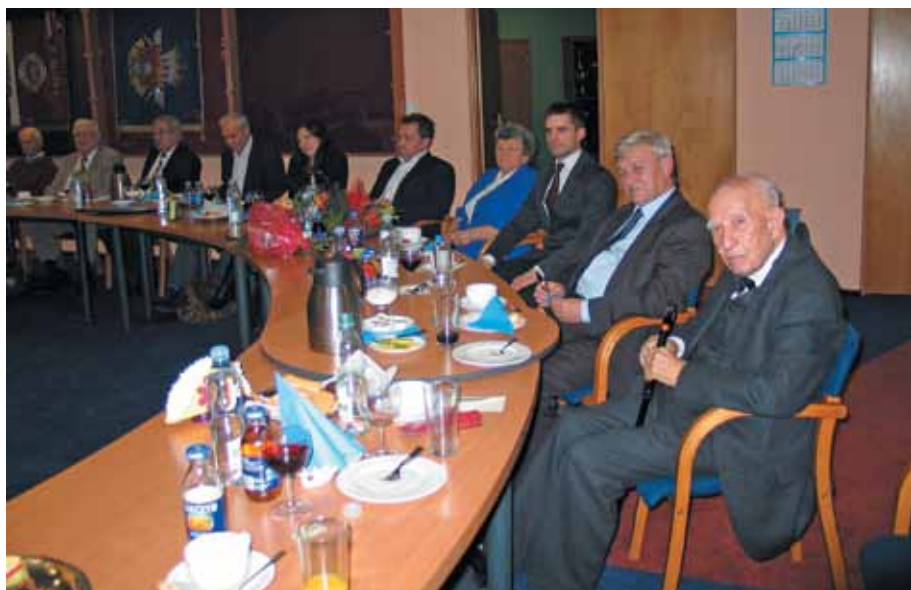
Seniorzy i goście w czasie Jubileuszu