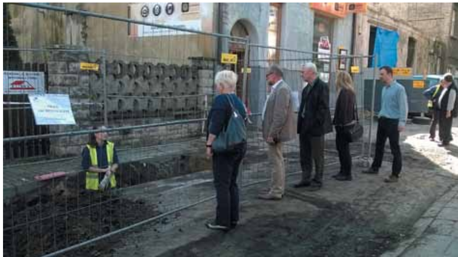
Zaplecze budowy w Cieszynie