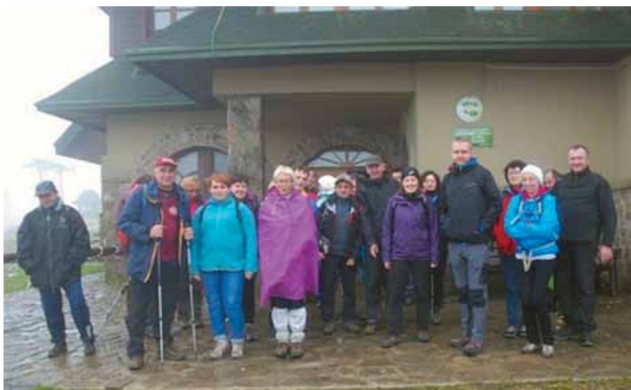
Uczestnicy wycieczki przed schroniskiem na Hali Miziowej