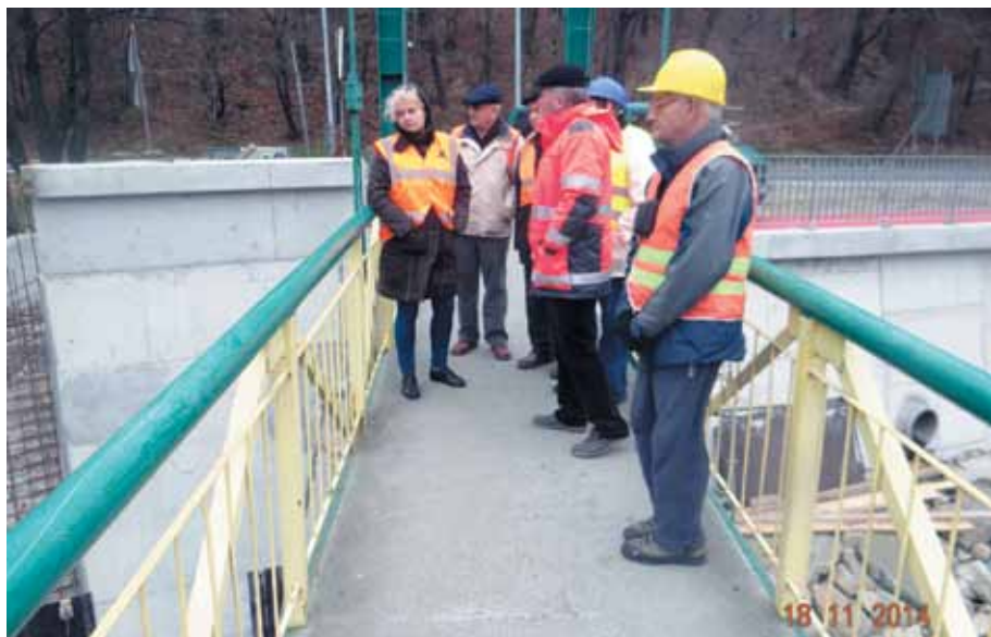
Kładka dla pieszych nad Popradem w Piwnicznej