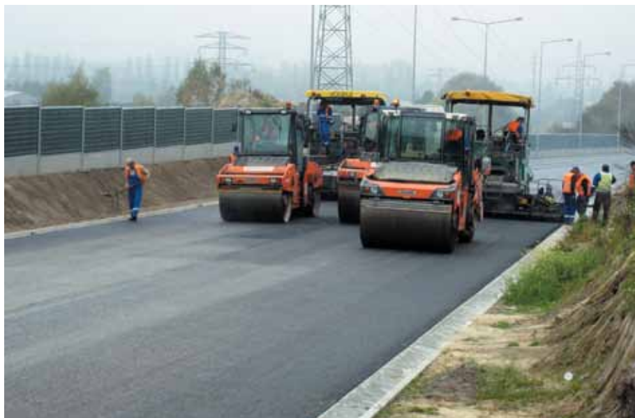
Obwodnica Skawiny – proces wałowania mieszanki

Opracowanie i zdjęcia: Beata Toporska Przewodnicząca Koła