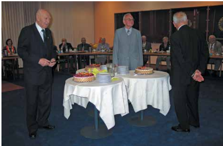
Jubilaci kroją urodzinowe torty