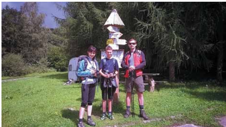
W drodze na Połoninę Wetlińską

Opracowanie i zdjęcia: Beata Toporska Przewodnicząca Koła