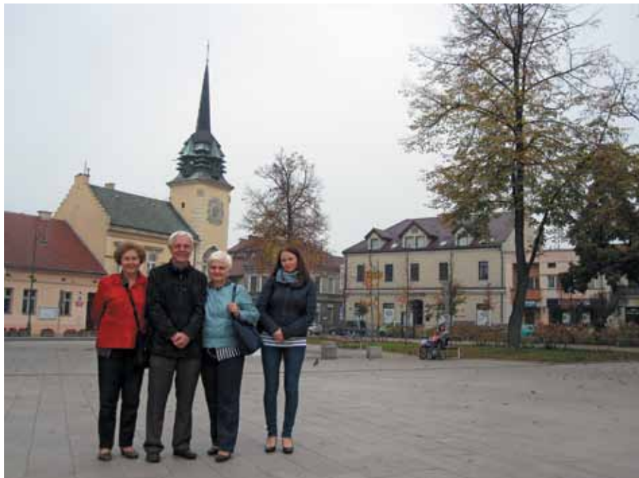
Uczestnicy wyjazdu na skawińskim rynku