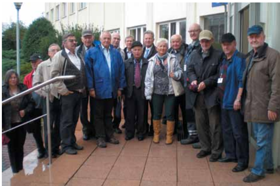
Przed wejściem do elektociepłowni