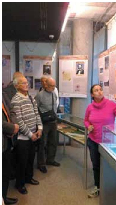
Wystawa „Igrzyska za drutami”