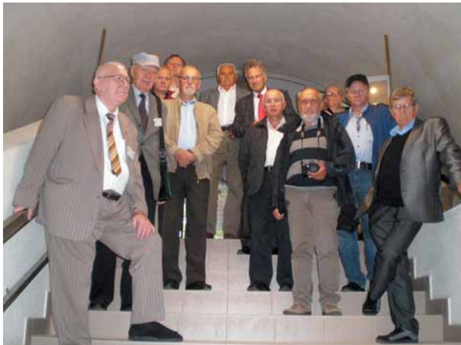
Zeżście do kopalni