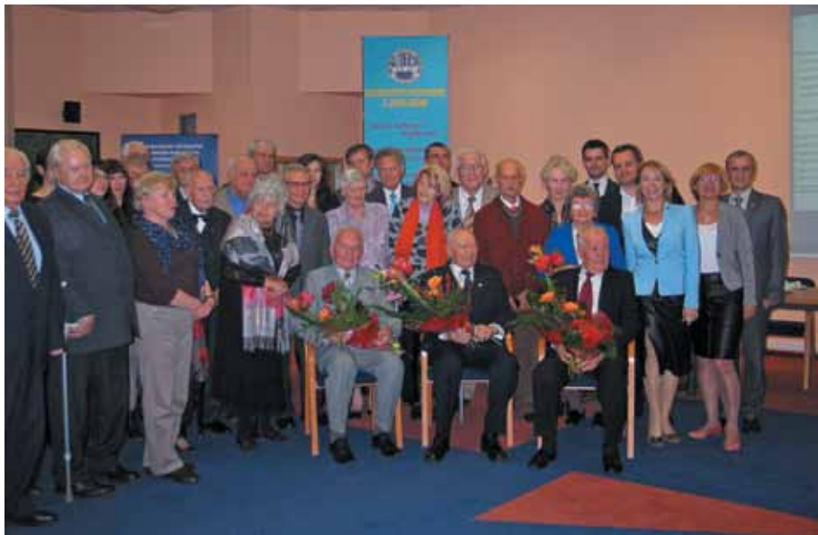
Pamiątkowe zdjęcie z Jubilatami