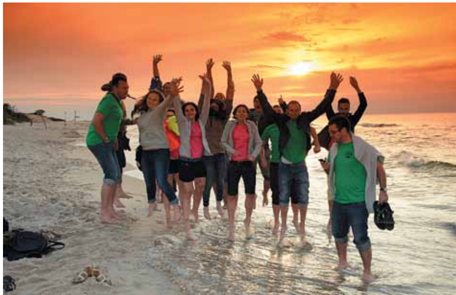
Nad morzem w miejscowości Rowy