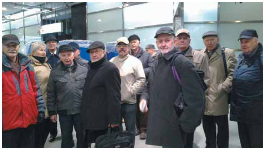
Na stacji metra