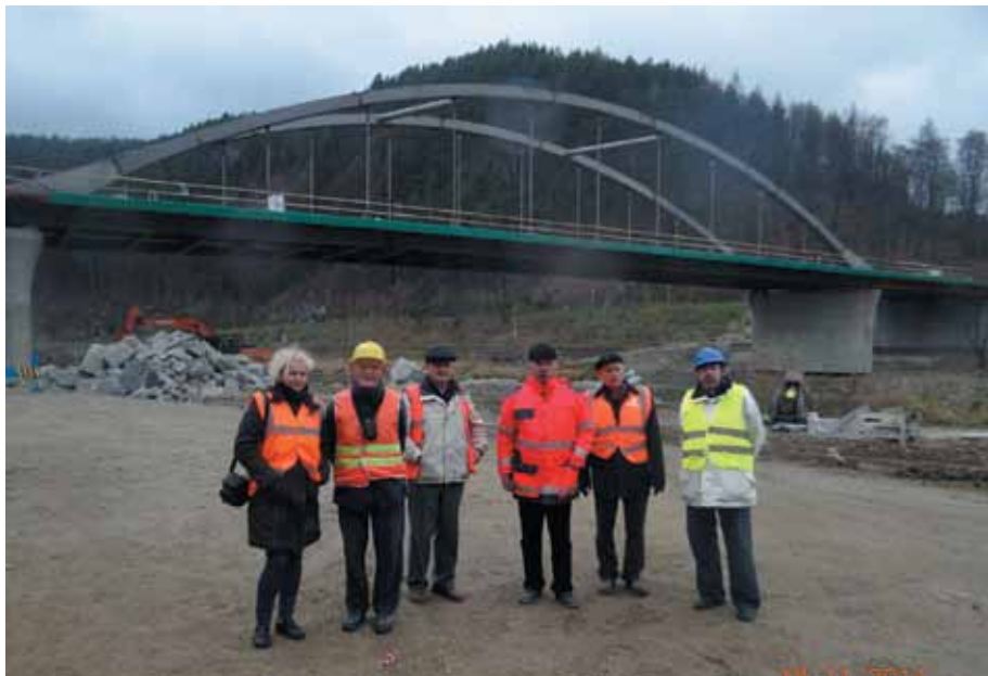
Most na Popradzie