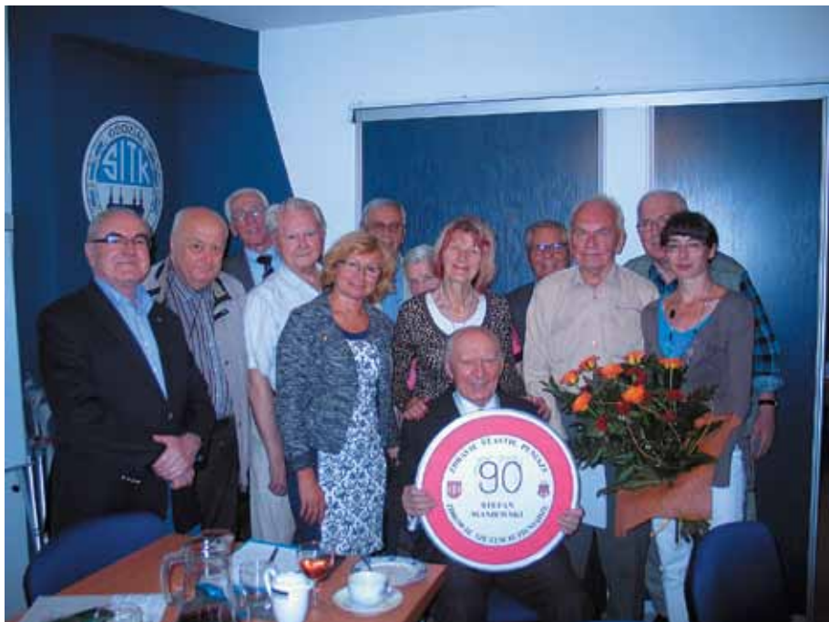
Wspólna fotografia z Jubilatem