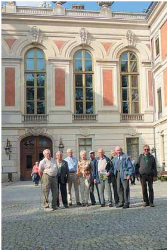
Zwiedzanie zamku w Pszczynie