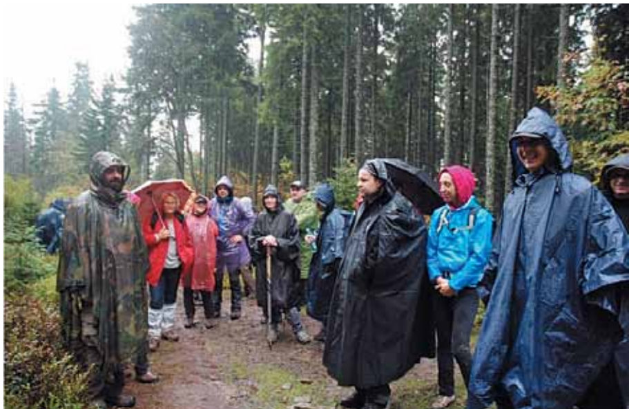
W drodze na Piłsko