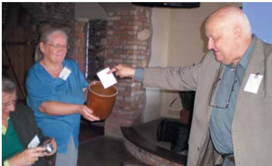
Wybory nowego Zarządu Klubu