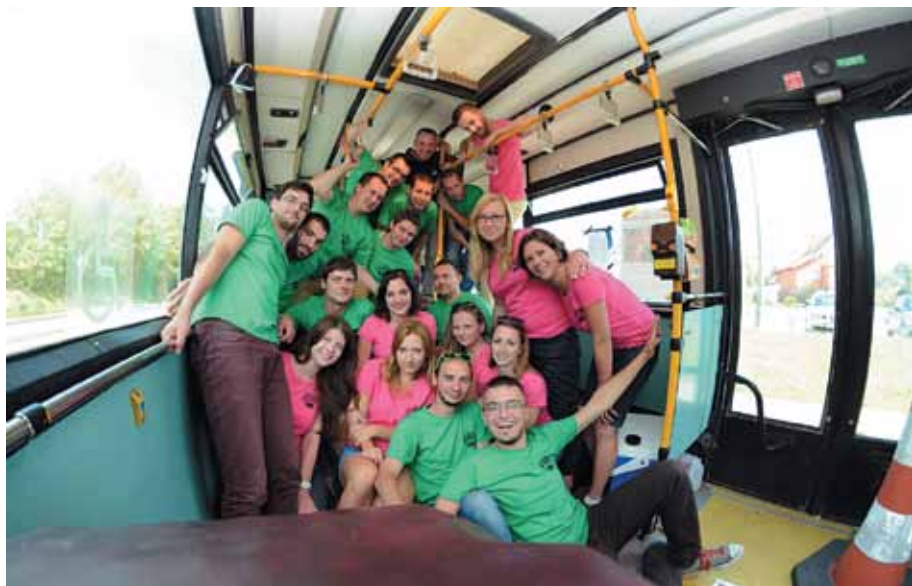
Uczestnicy w tradycyjnych koszulkach PL 2014