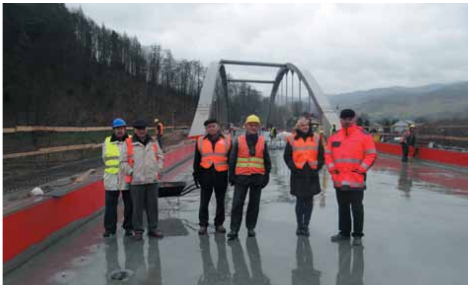
Most graniczny na Popradzie