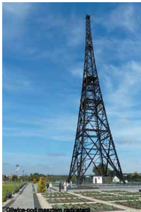
Seniorzy pod wieżą gliwickiej rozgłośni radiowej

Opracowanie: Jerzy Bąkowski, Sekretarz Klubu Seniora