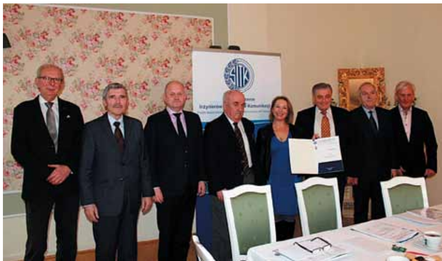
Członkowie Komitetu Nauki na posiedzeniu w dniu 3 marca br.