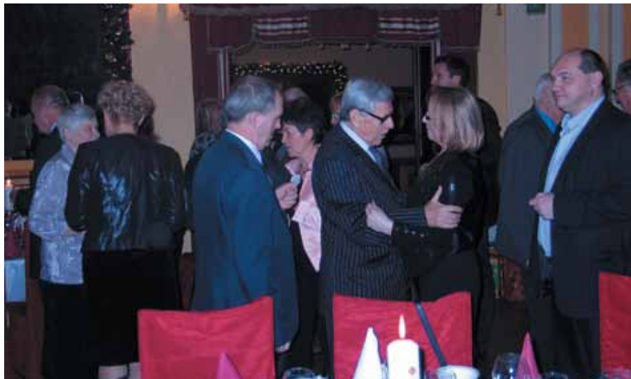
Członkowie Oddziału składają sobie świąteczne życzenia