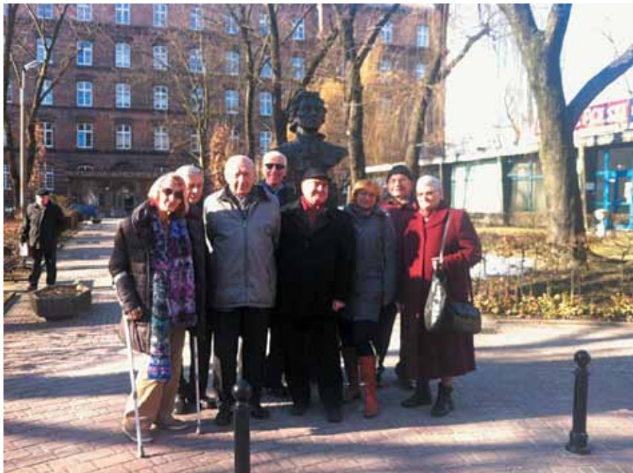
Wspólne zdjęcie Seniorów przy popiersiu Tadeusza Kościuszki - patrona Politechniki Krakowskiej