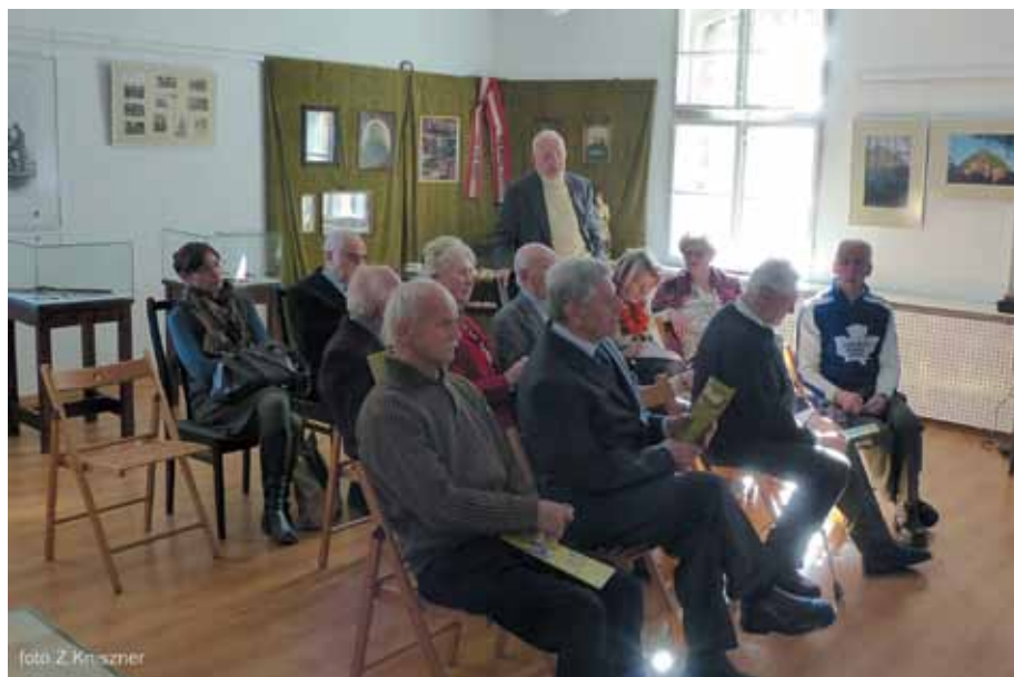
Obrady zebrania sprawozdawczego