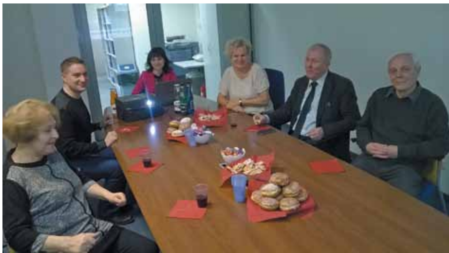
Spotkanie sprawozdawcze członków Koła w Mota Engil Central Europe S.A. w siedzibie Firmy