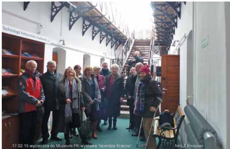
Seniorzy w budynku „Aresztu” – w Muzeum Politechniki Krakowskiej