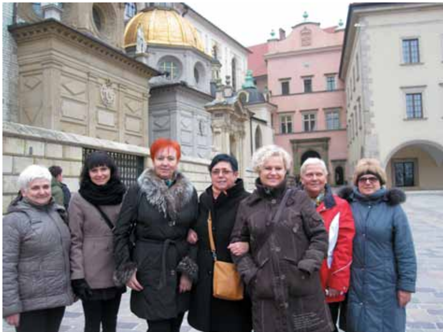
Na wawelskim dziedzińcu

Ostatnim punktem wycieczki były prywatne apartamenty królewskie, których wyposażenie sięga epoki renesansu. Wśród eksponatów na uwagę zasługują włoskie obrazy z kolekcji Lanckorońskich, barwne fryzy ścienne, czy zbiory porcelany miśnieńskiej i sreber stołowych. Na koniec wspólnego wyjścia na Wawel cześć grupy odwiedziła grób Prezydenta Lecha Kaczyńskiego i jego małżonki Marii Mackiewicz–Kaczyńskiej.