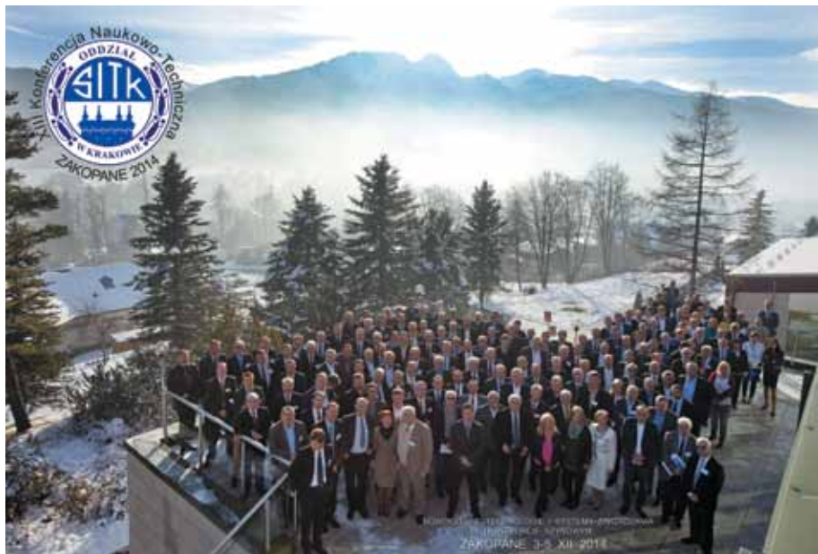
Grupowe zdjęcie uczestników konferencji.