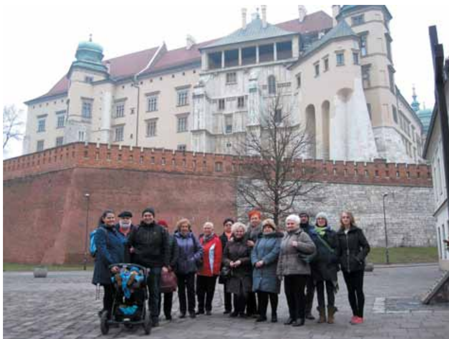
Uczestnicy wycieczki u stop Wawelu

interesująco opowiadała o historii zamku, jak również o postaciach mających wpływ na jej przebieg.