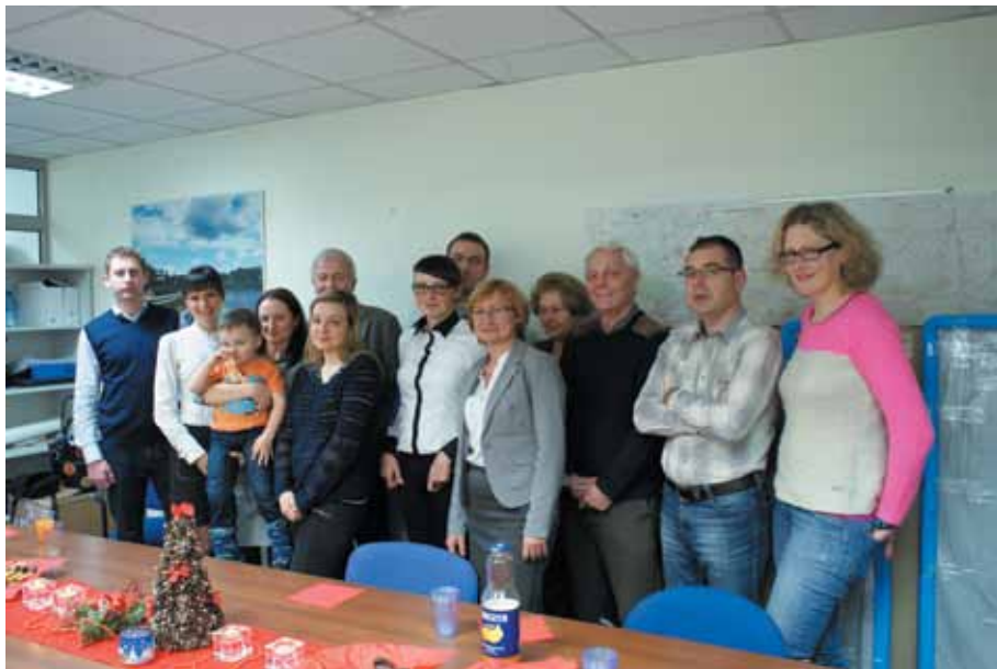
Wspólna, pamiątkowa fotografia uczestników spotkania